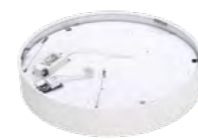
Treiber und Anschluß für den direkten Lichtanteil