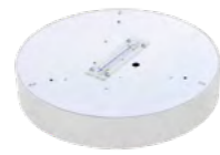
Indirekter Lichtanteil der Pendelleuchte