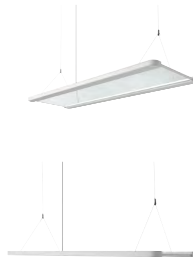
LICHTVERTEILUNGSKURVE 53 Watt (PL20a.5384.Mi.S4W1)

Farbe: Schwarz, mit Echtholzdekor Farbwiedergabe: CRI > 90 Optisches System: Mikropismatik für direkt strahlenden Anteil Lichtfarbe: Tunable White, 5000 K Notlicht: möglich Form: mit geraden Endkappen